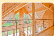
DÉCEMBRE - BT16B