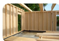
DÉCEMBRE - BT54