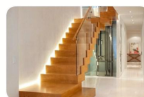
DÉCEMBRE - BT18A