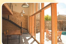
DÉCEMBRE - BT19B